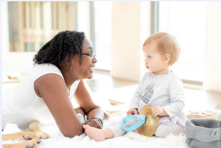
La relation puéricultrice-enfant : un lien essentiel pour le développement

Collabore activement avec les familles pour assurer une continuité éducative entre la crèche et le foyer.