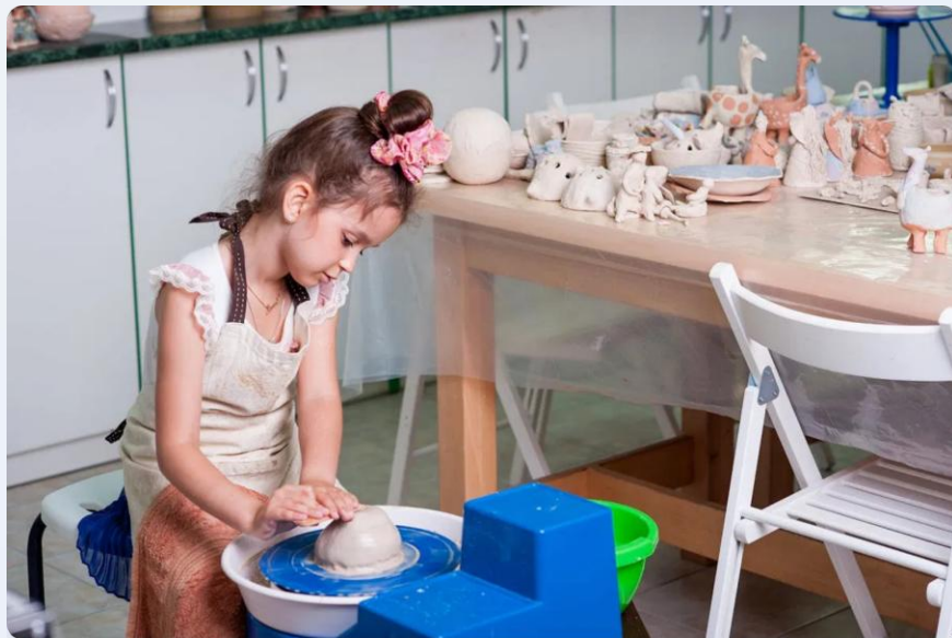
Des activités culturelles adaptées aux tout-petits

Structurer les pratiques à travers des activités cohérentes et accessibles